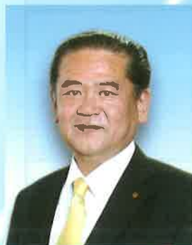
八代港ポートセールス 協議会会長(八代市長) 中村 博生