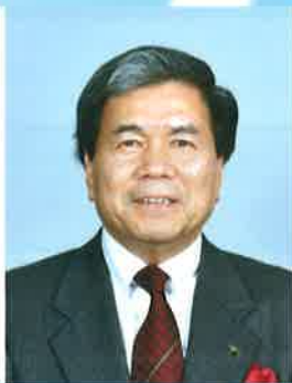
熊本県知事 蒲島 郁夫