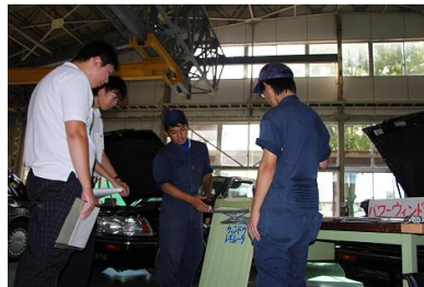
（パワーウィンドウの説明）