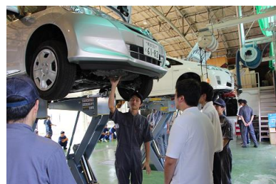
（ハイブリッド車の下回り説明）