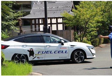
(クラリティ体験試乗)