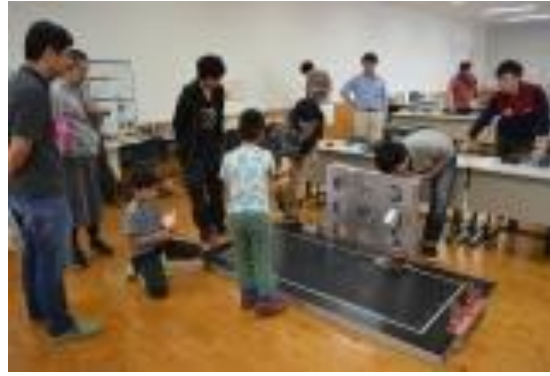
学生が作成したロボットのデモンストラーションに子供たちも興味津々