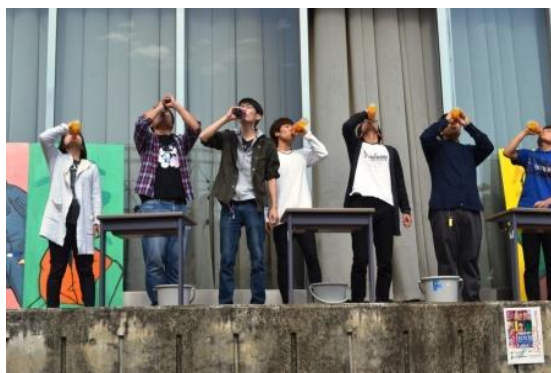
飛び入り参加も出た早飲み競争

施設見学や進路相談などは随時受け付けております。希望される方は、総務学生課までお問い合わせください。