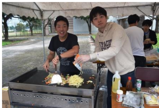
慣れた手つきでおいしい焼きそばを作ってくれました。