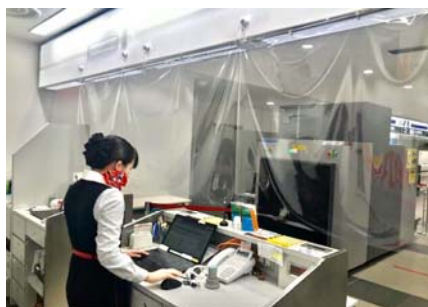
ビニールカーテンの設置