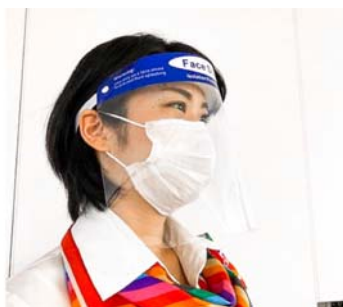
地上係員のマスク・フェイスシールド着用