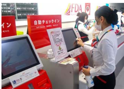
自動チェックイン機の消毒

空港ではソーシャルディスタンスの観点で、チェックインカウンターなどにおいて、可能な限りお客さま同士の距離を確保するために、距離の目安を伝える展示をしております。みなさまのご理解とご協力をお願い申し上げます。