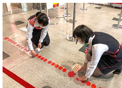
空港内でのソーシャルディスタンス