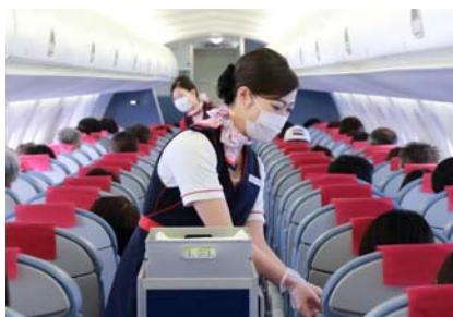
客室乗務員のマスク・手袋着用